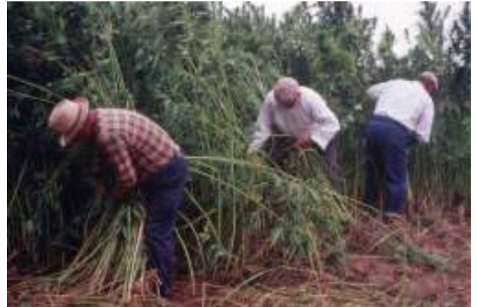
Arrachage à bras, rouissage en Loire Démonstration de "brayage" et "lissage" à la "Forge", site des expositions et animations de l'écomusée.