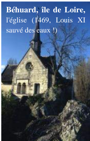
Béhuard, île de Loire, l'église (1469, Louis XI sauvé des eaux !)