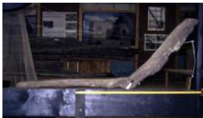
A "La Forge (bâtiment industriel des années 1850 / 80), siège de l'ancien écomusée de Montjean Loire Angevine, réunion d'une collection unique d'environ 200 bois d'épaves de tous types de bateaux