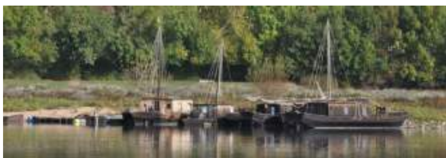
Salut à la Possonnière à la flottille des "Gens d'Louère", répliques de "passe cheval" et de toues